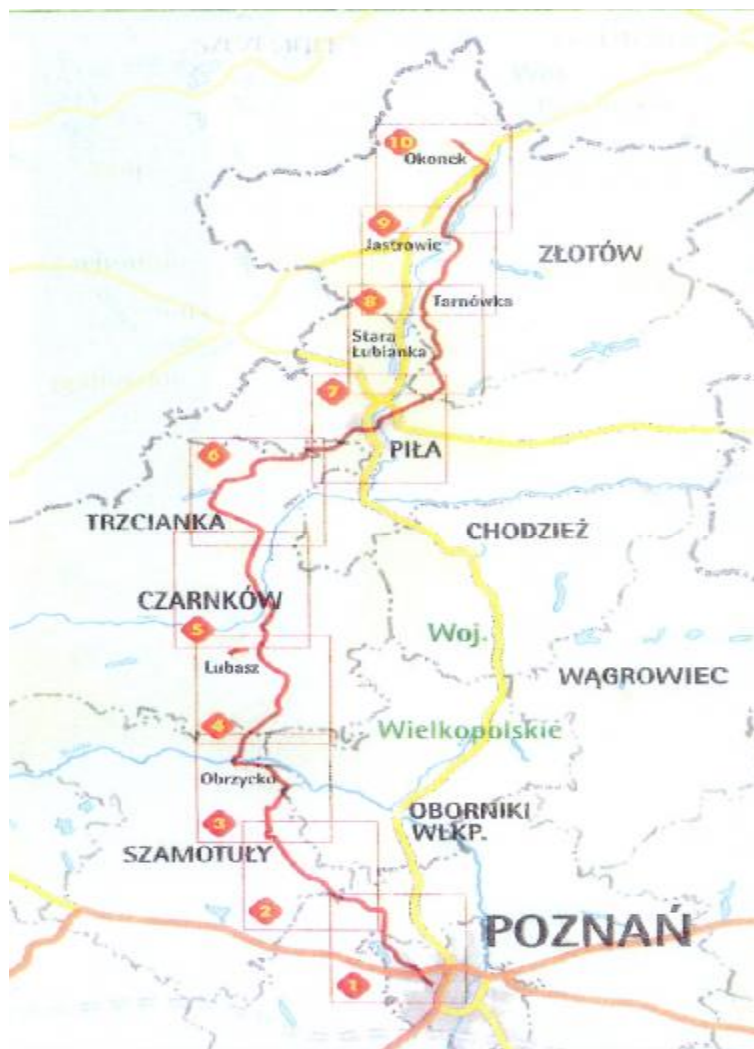
Rysunek 2. Transwielkopolska Trasa Rowerowa

Miasto ma dobre połączenie kolejowe w kierunku zachodnim z Piłą – Krzyżem, w kierunku wschodnim ze Złotowem – Chojnicami – Tczewem. Z miejscowości tych ma połączenia we wszystkich kierunkach.