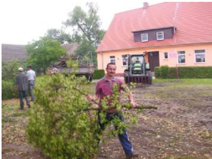
Fot. Mieszkańcy Podróżnej podczas prac społecznych na rzecz wsi

Na dzień 28 lutego 2013 r. w Podróżnej jest zarejestrowanych osób bezrobotnych 33 w tym 15 kobiet. Z prawem do zasiłku jest 9 osób w tym 3 kobiety. Liczba bezrobotnych w stosunku do gminy Krajenka wynosi 6,65 %, wśród kobiet 5,64 %.