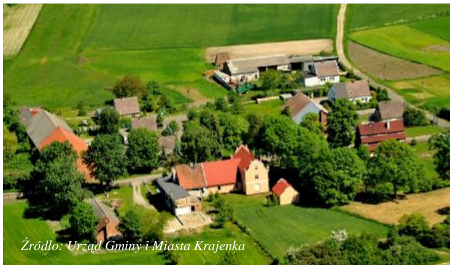
Foto. Podróżna- założenie dworsko-folwarczne.

Wieś Podróżna należy do jednej z sześciu historycznych układów ruralistycznych. Miejscowość ta założona została na układzie przestrzennym – skrzyżowanie trzech dróg. Zachowało się założenie dworsko-folwarczne 2 połowa XIX w. ( dwór, obecnie kaplica p.w. św. Michała, kuźnia ze spichlerzem i częścią mieszkalną, budynki inwentarsko-gospodarskie, dom ogrodnika), przedszkole koniec XIX w., szkoła niemiecka- lata 20-te XX w., cmentarz ewangelicko-augsburski – połowa XIX w., 28 domów murowanych z końca XIX w. i początku XX w., cmentarz katolicki – 2 połowa XIX w., 2 czworaki, dwojak i ośmiorak z 2 połowy XIX w.