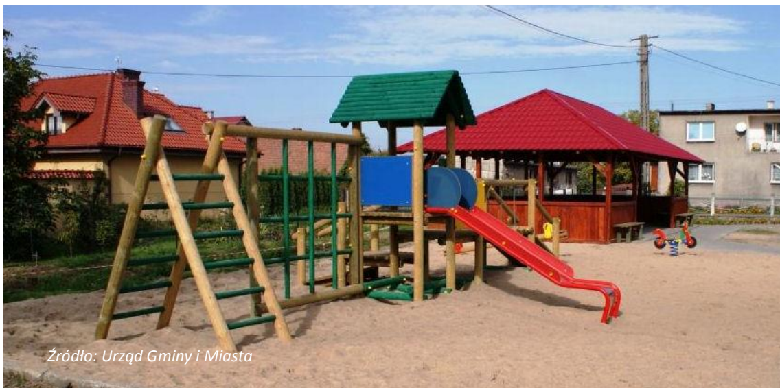
Fot. Podróżna-plac zabaw z wiatą

Na terenie wsi znajdują się: kościół, świetlica wiejska, plac zabaw, boisko do gry w piłkę nożną, wiata, remiza OSP. W świetlicy odbywają się zebrania mieszkańców, środowiskowe, organizacje pozarządowych. Wiata służy mieszkańcom do spotkań integracyjnych, zabaw.