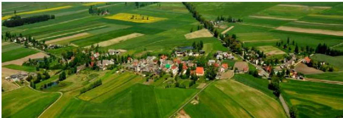
Fot. Widok wsi Podróżna

Wieś Podróżna należy do jednej z sześciu historycznych układów ruralistycznych. Miejscowość ta założona została na układzie przestrzennym – skrzyżowanie trzech dróg. Zachowało się założenie dworsko-folwarczne 2 połowa XIX w. ( dwór, obecnie kaplica p.w. św. Michała, kuźnia ze spichlerzem i częścią mieszkalną, budynki inwentarsko-gospodarskie, dom ogrodnika), przedszkole koniec XIX w., szkoła niemiecka- lata 20-te XX w., cmentarz ewangelicko-augsburski – połowa XIX w., 28 domów murowanych z końca XIX w. i początku XX w., cmentarz katolicki – 2 połowa XIX w., 2 czworaki, dwojak i ośmiorak z 2 połowy XIX w.