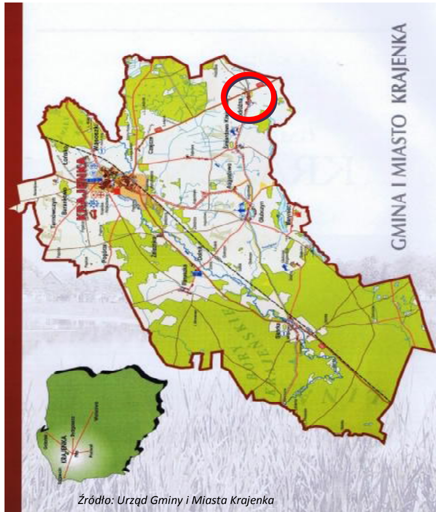
Rys. 1.1 Położenie geograficzne wsi Podróżna w gminie Krajenka

Podróżna przynależy do Gminy Krajenka, znajduje się w granicach administracyjnych powiatu złotowskiego.